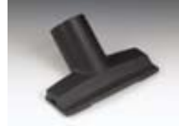
Насадка для мебели

имеет все необходимые для монтажа элементы, такие как широкий ассортимент комплектующих и запасных частей.