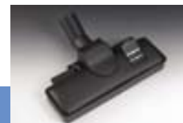
Комбинированная насадка с защитным колпаком