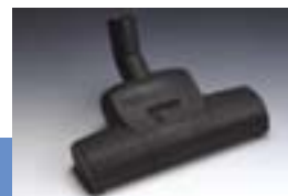
Щетка для ковров