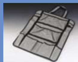
Сумка для хранения принадлежностей