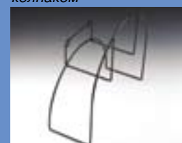
Кронштейн для шланга