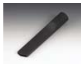
Насадка для пылеудаления из швов