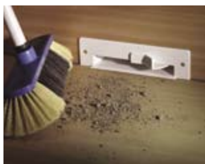
Пристенная всасывающая розетка Vac-Pap

предназначен для сбора крупного мусора, например, остывший пепел или стружка.