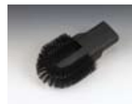
Щетка для радиаторов