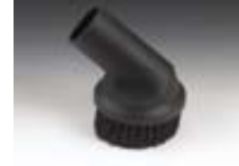
Щетка для мебели