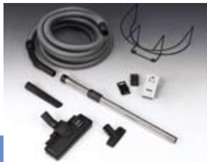
Набор для пылеудаления